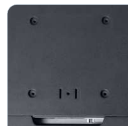
Fixations normalisées VESA